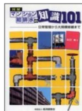
山口氏著書 図解・マンション給排水の知識101

■住宅金融支援機構（旧住宅金融公庫）、（公財）マンション管理センター、（一財）経済調査会及び地方公共団体等主催の講演会の各地の管理組合団体、多数の実績と著作がある。