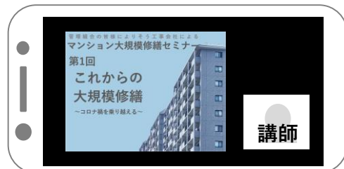
スマートフォンでの参加イメージ

セミナー終了後、自動で右のような画面が起動します。“続行”ボタンをクリックし、アンケートのご協力をよろしくお願いいたします。